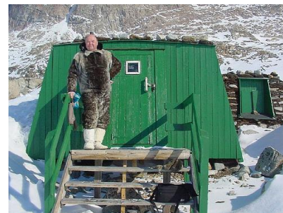
Julemendens hus i Uummannaq

Se Generelle betingelser på vores hjemmeside www.polarrejser.com