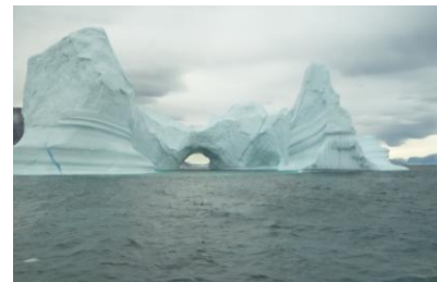
Udsigt fra Hotellets restaurant.