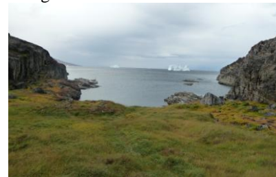
Qilakitsoq eskimoisk boplads