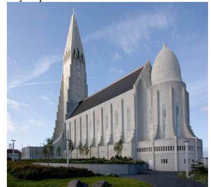
Halvgrímskirken i Reykjavik