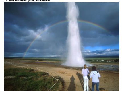
Geysir på Island