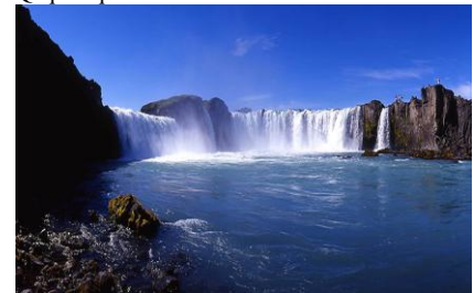
Vandfald på Island