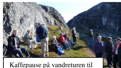
Kaffepause på vandreturen til Sermermiut i Ilulissat

På denne tid af året skinner solen 24 timer i døgnet. Undtagen tur nr. 12091-G