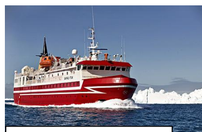
Skibet fra Ilulissat til Sisimiut

Det vigtigste erhverv er fiskeri. Naturen er en af Grønlands største ressourcer og den kan f.eks. nydes i Sisimiut på vandre- og sejlture. Byen byder også på spændende kulturoplevelser, der er kunstværksted og skindsystemer, samt interessante fortidsminder. Butikkerne er samlet omkring hovedgaden, hvor man også finder ”brættet”, stedet hvor de lokale fangere sælger dagens fangst af fisk, sæl, rensdyr, fugle mm. Området byder på gode muligheder for lette vandreture i fjeldet. På egen hånd, men efter anvisning.