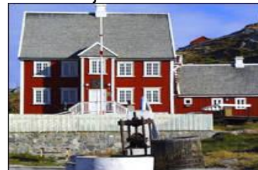
Knud Rasmussens Museum